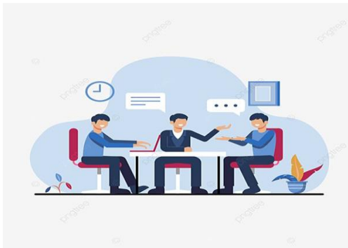
KOORDINASI DENGAN KETUA CLUSTER/PAGUYUBAN UMKM