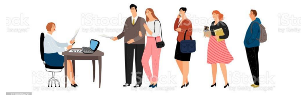
PENYERAHAN NIB KEPADA PEMOHON