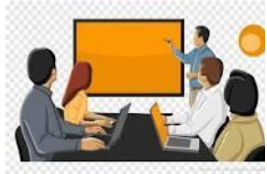
PENJADWALAN KEGIATAN JEMPOL KEPALU